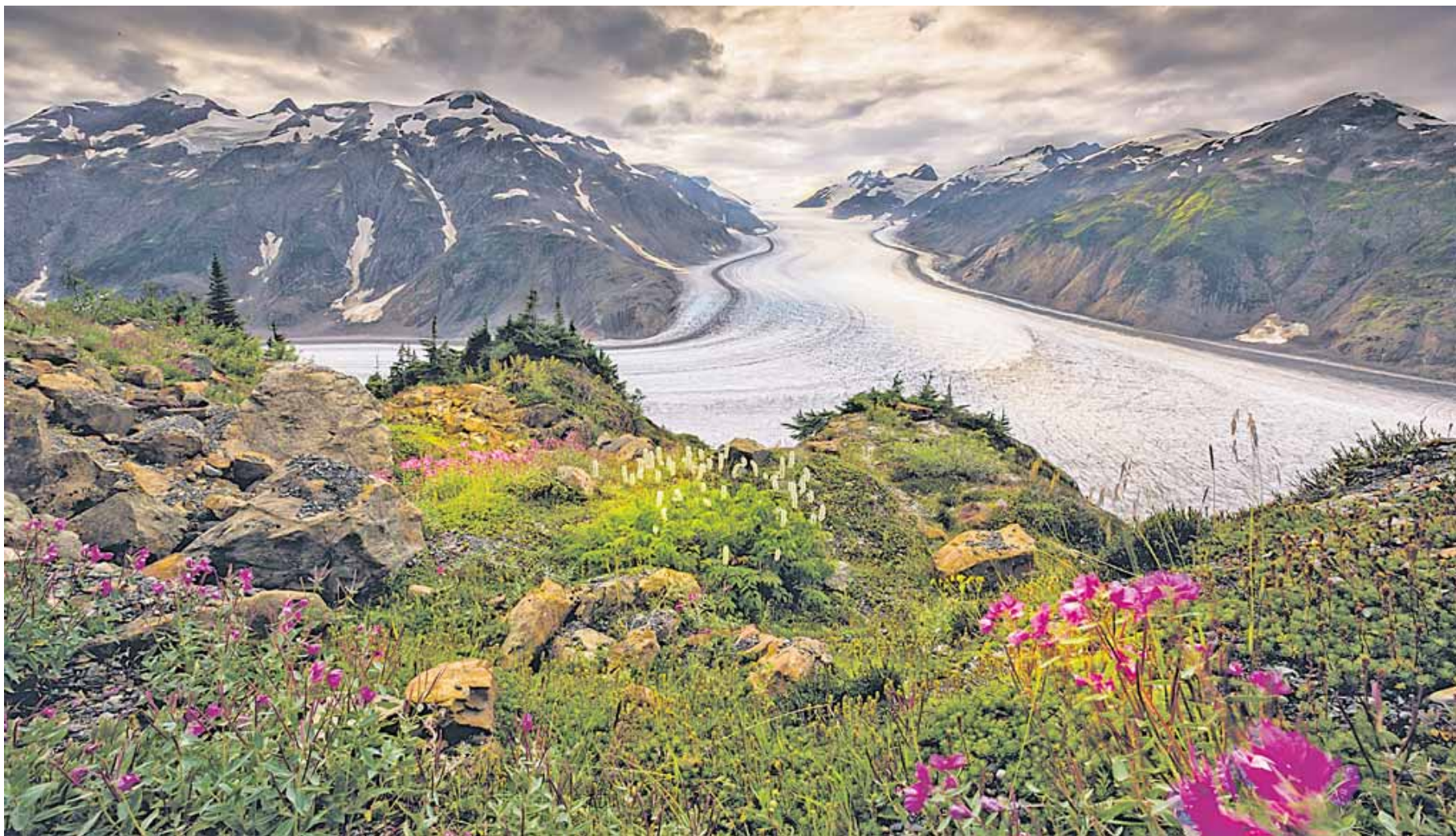
Eine Übernachtung am Salmon Glacier haben sich Mario und Ramona Goldstein nicht entgehen lassen, ehe sie am nahen Lake Laberge ihr Floß zusammengebaut haben. Sie haben es Rainboweagle getauft und sind damit rund 3000 Kilometer den Yukon hinuntergefahren. 64 Tage waren sie auf dem Fluss unterwegs, in Begleitung des Kameramanns Patrick Schilbach. Kein Tag zu viel: Knapp vor dem Wintereinbruch haben sie die Beringsee erreicht.